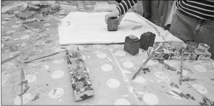
Die Kunstschule Kassiopeia bedruckt am Weltkindertag T-Shirts von Kindern und Jugendlichen (aufgenommen am Eröffnungswochenende der Urban Art Biennale 2022)