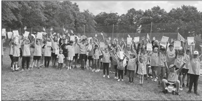
Kinder, Jugendliche und Trainer des TC 77 Heidstock in den aktuellen T-Shirts vor dem Center-Court

Für das 23. Sommer-Camp 2024 in der letzten Ferienwoche liegen schon die ersten Voranmeldungen vor.