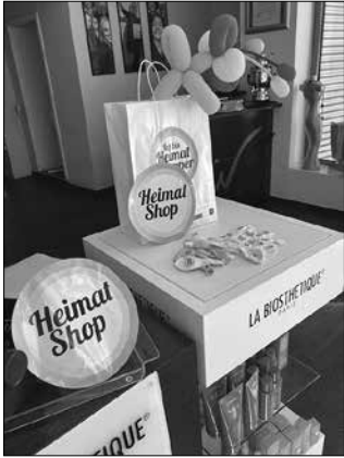
Ob Handel, Gastronomie oder Dienstleister: Das „Heimat shoppen“ in Völklingen fand großen Anklang.

Es waren zwei Tage, die Völklingen belebten und zusammenbrachten. Am 8. und 9. September 2023 setzte die Aktion „Heimat shoppen“ ein Zeichen für den lokalen Handel. Die Resonanz fiel durchweg positiv aus.