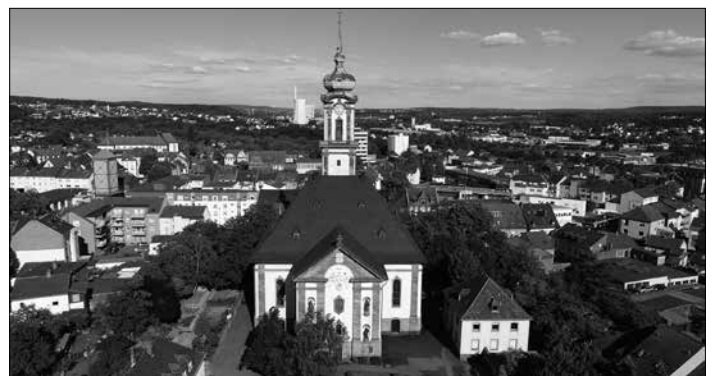
Der Besuch der Versöhnungskirche mit dem imposanten Deckengemälde ist Teil der Stadtführung