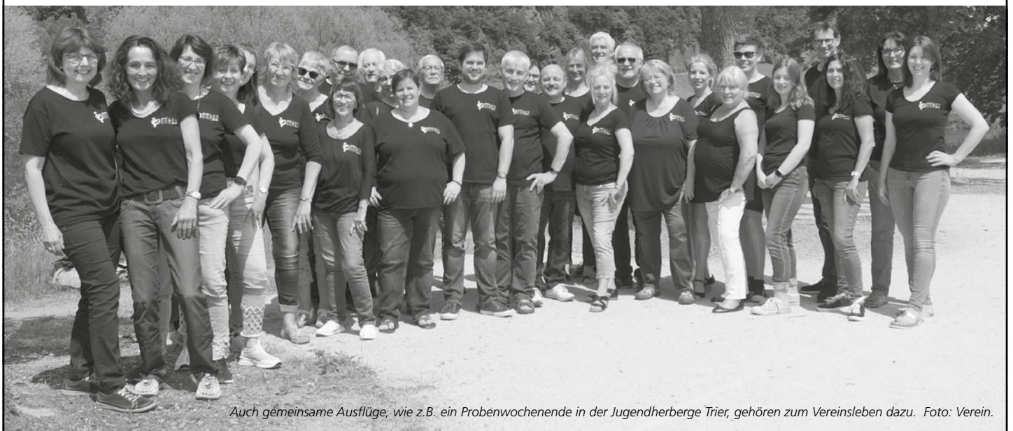
Auch gemeinsame Ausflüge, wie z.B. ein Probenwochenende in der Jugendherberge Trier, gehören zum Vereinsleben dazu.

Wie wär's? Wenn dein Interesse geweckt ist – und du vielleicht auch schon ein wenig Gesangs- oder Chorerfahrung mitbringst – würden wir uns über dich freuen! Wenn du noch Fragen hast, schreibe uns via anfrage@stimmimpuls-chor.de . Im Internet findest du uns auf www.stimmimpuls-chor.de und in den sozialen Medien über @stimmimpulschor .