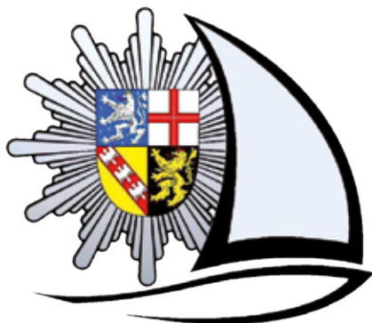
Polizeisportverein Saar e.V.