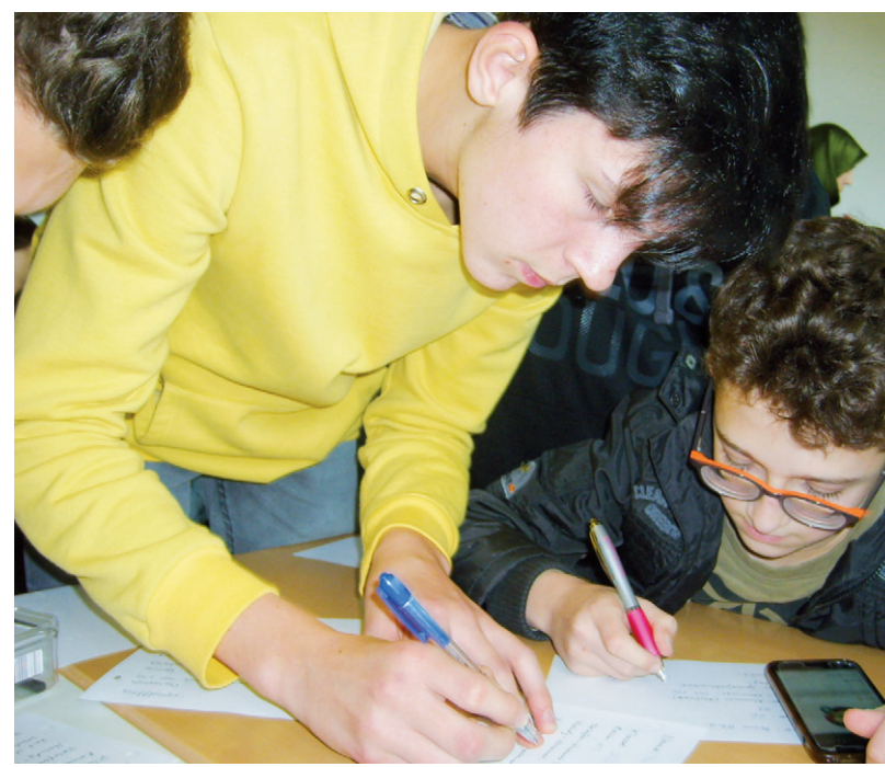
Sprachpaten beim gemeinsamen Arbeiten

Das Projekt der Sprachpatenschaften läuft in Völklingen an insgesamt drei Gymnasien: Am Marie-Luise-Kaschnitz-Gymnasium, am Warndt-Gymnasium und der Hermann-Neuberger-Schule. Insgesamt sind derzeit insgesamt 43 Sprachpaten verzeichnet.