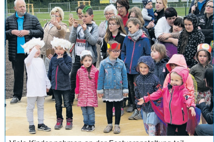
Viele Kinder nahmen an der Festveranstaltung teil.

Klaus Lorig Oberbürgermeister der Stadt Völklingen