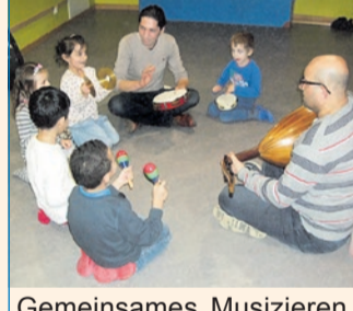
Gemeinsames Musizieren im Workshop

Die Kunstwerke wurden sehr farbenfroh und verschönern nunmehr den Speiseraum der KiTa. Die Mädchen und Jungen bastelten unter Anleitung zudem kleine Laternen und kochten Falafel, ein traditionelles Gericht aus Syrien. Außerdem wurde getanzt, musiziert und eine Geschichte improvisiert dargestellt. In einer weiteren Aktion entstand aus viel Kleister und Papier ein Kamel. Die Kinder waren mit viel Freude und Motivation bei diesem Projekt dabei.