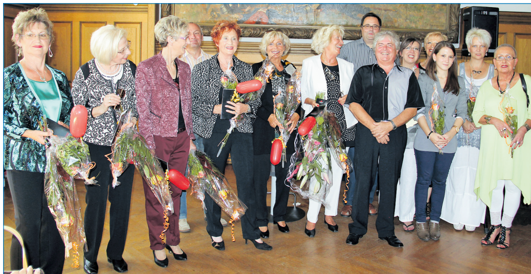
Freuten sich gemeinsam über zwei Jahrzehnte Seniorenakademie

nale Einrichtung in Völklingen. Dass gute Entwicklung und Erfolg der Seniorenakademie durch engagierte Menschen vor Ort sichergestellt worden sei, hob er besonders hervor. Willi Kräuter, Referatsleiter für allgemeine und politische Weiterbildung im Ministerium für Bildung und Kultur, lobte die VHS Völklingen gleichzeitig als innovativste VHS im Saarland und betonte, dass Bildungsminister Agostini anschließend durch eine Modenschau. Die Modells waren selbstverständlich Akademiemitgliederinnen und präsentierten die neueste Mode von Modehaus Folz, Schuhhaus Agostini, Optik Mudrack und Salon Lydia. Ein gelungener Ausklang folgte mit Kaffee, Kuchen und mit vielen Gesprächen.