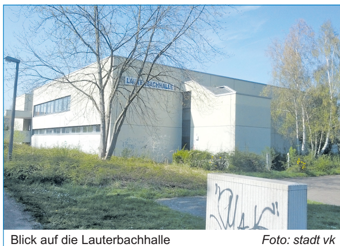
Blick auf die Lauterbachhalle

lage mit einem Wirkungsgrad von 85 Prozent erhalten. Zudem sind im Wirtschaftsplan 2013 insgesamt 350.000 Euro avisiert, um die vorhandene Gebäudehülle mit einem 24 Zentimeter dicken Wärmedämmverbundsystem zu schützen. Das Dach erhält eine 300 Millimeter starke Dämmung. Der Grundstücks- und Gebäudemanagementbetrieb hat dem Ministerium für Wirtschaft, Arbeit, Energie und Verkehr einen Förderantrag auf der Grundlage des Programms EFRE Saarland „Regionale Wettbewerbsfähigkeit und Beschäftigung“ vorgelegt. Zu den Maßnahmen, die vom Zuwendungsgeber anerkannt werden, wird die Stadt einen Zuschuss von 40 Prozent erhalten. Die Halle wurde bereits gesperrt. Mit den vorbereiteten Arbeiten wurde begonnen. Es ist vorgesehen, unmittelbar nach den Sommerferien den Hallenbetrieb wieder freizugeben. Die Nebenräume der Halle werden bis November fertiggestellt. Im April 2014 soll der Anbau fertiggestellt sein.