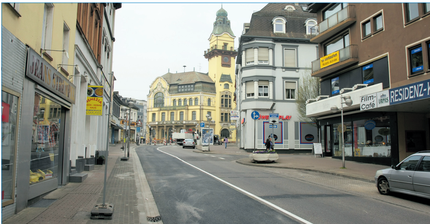
Wieder für den Verkehr frei: die Karl-Janssen-Straße