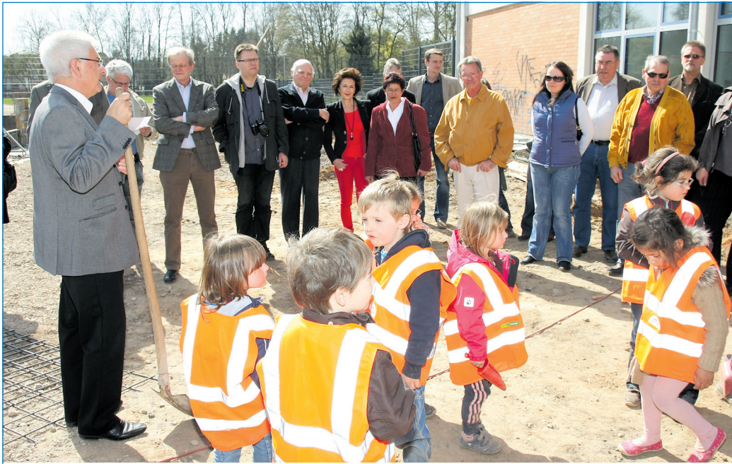
Mit eigenen Spaten waren auch die Kinder der Kita zur Stelle.

Bei dieser Gelegenheit wies er darauf hin, dass der Bedarf und damit wahrscheinlich auch die Nachfrage nach Krippenplätzen die erforderlichen 35 Prozent nach 2013 überschreiten würden. Eine Umfrage des Forsa-Instituts im Auftrag der Bundesvereinigung der kommunalen Spitzenverbände, nach der eine Nachfrage bis zu 66 Prozent zu erwarten sei, wertete er dabei als Bestätigung seiner Einschätzung. Im Beisein zahlreicher Ratsmitglieder, Vertreter von Schule und Kinderstätte so-