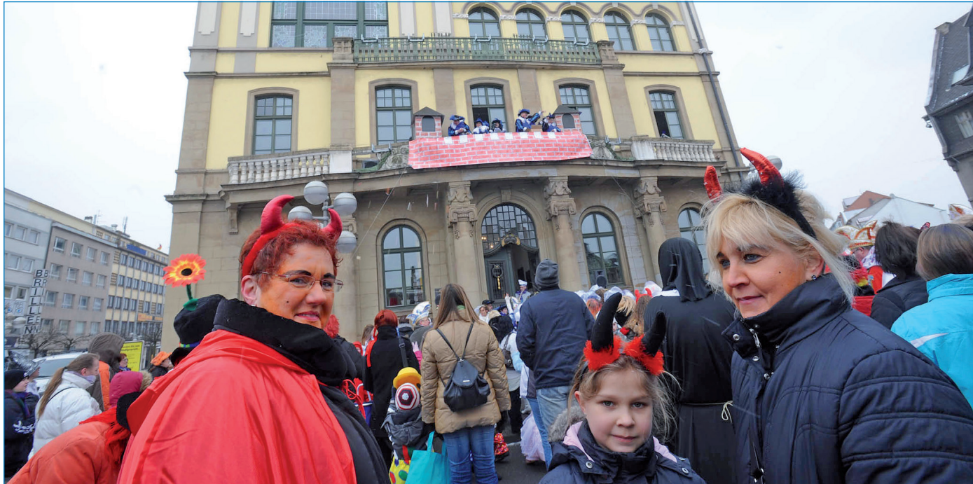
Auch in diesem Jahr wird wieder das Alte Rathaus in Völklingen gestürmt.

Für unverlangt eingesandte Artikel übernimmt die Redaktion keine Haftung.