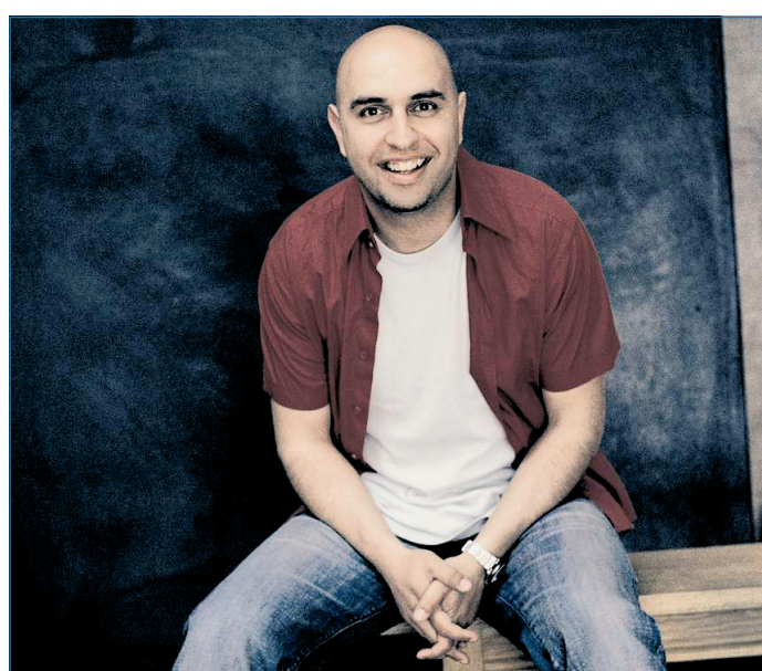
Serdar Somuncu tritt mit seinem Programm „Hassprediger“ in der Kulturhalle Völklingen-Wehrden auf.

Die Stadt Völklingen beteiligt sich in diesem Jahr an der „Internationalen Woche gegen Rassismus“. Die jährlich stattfindende Veranstaltungsreihe wird vom Regionalverband ausgerichtet und startet in der Stadt Völklingen am 19. März 2011 um 18 Uhr in der Kulturhalle Völklingen-Wehrden mit dem bekannten Kabarettisten Serdar Somuncu. Dieser tritt mit seinem Programm „Hassprediger“ auf. Der Regionalverband und die Stadt Völklingen laden ein, die eigenen Grenzen der Toleranz auszuloten. Somuncus Programme sind nie bequem – weder für die Migranten noch für die Deutschen. Er verteilt reichlich Backpfeifen. Dabei geht er oft bis an die