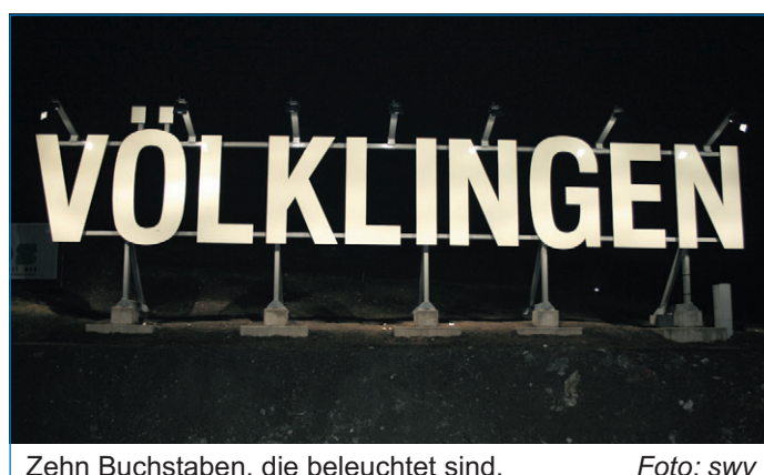
Zehn Buchstaben, die beleuchtet sind.

Kaj Michaltzik, der in Völklingen wohnt und zum damaligen Zeitpunkt hier zur Schule ging, brachte die Idee ein. Durch die großen Buchstaben am Ufer der Saar soll von der Autobahn aus für jedermann erkennbar sein, an welchem Ort er gerade vor-