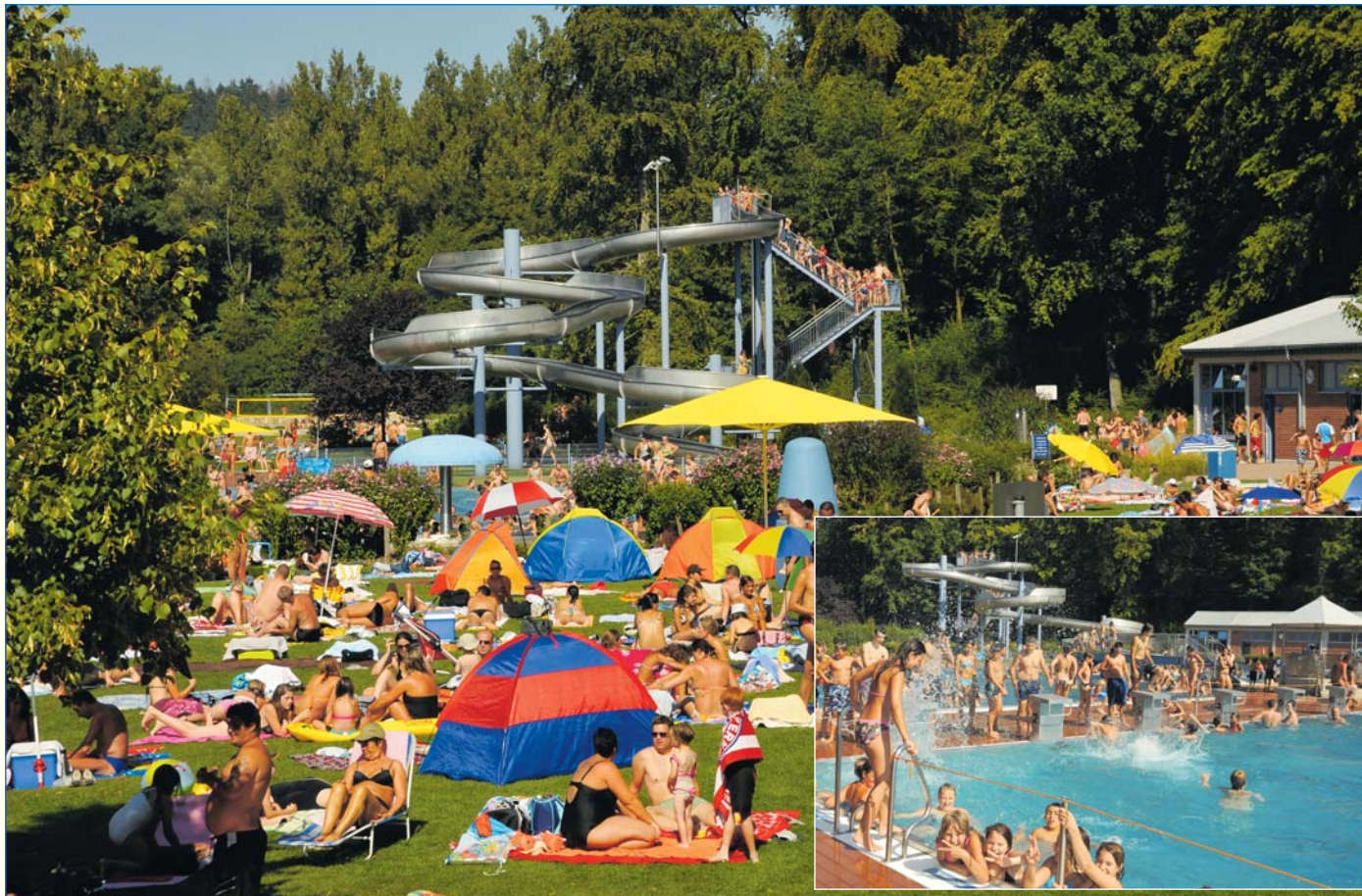
Das Völklinger Erlebnisfreibad Kollerbachthal bietet seinen kleinen und großen Besuchern Spaß und Erholung

Für unverlangt eingesandte Artikel übernimmt die Redaktion keine Haftung.