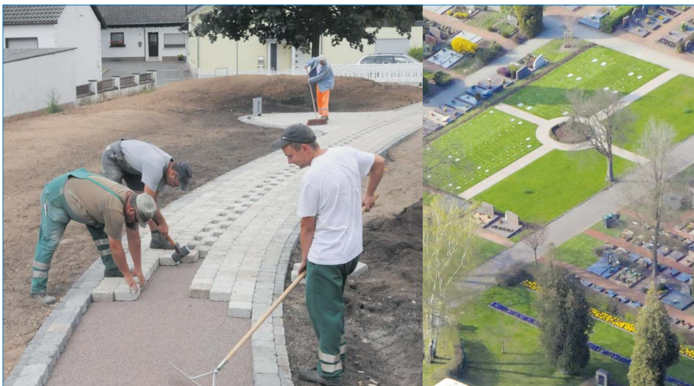
Linke Seite: Arbeiten an der Grünanlage Gärtnerstraße, rechte Seite: Friedhof Fürstenhausen Rasengrabfeld

Planschbecken mit Wasserpilz, Elefantenrutsche und Spritznashorn den steigenden Temperaturen trotzen können. Und wer genug vom kühlen Nass hat, kann sich auf dem Spielplatz oder an den Tischtennisplatten und auf den Beachvolleyballfeldern die Zeit vertreiben. Auch für das leibliche Wohl wird natürlich bestens gesorgt.