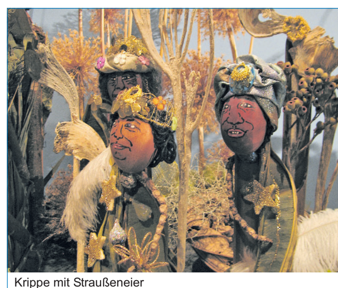
Krippe mit Straußeneier