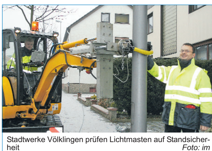
Stadtwerke Völklingen prüfen Lichtmasten auf Standsicherheit