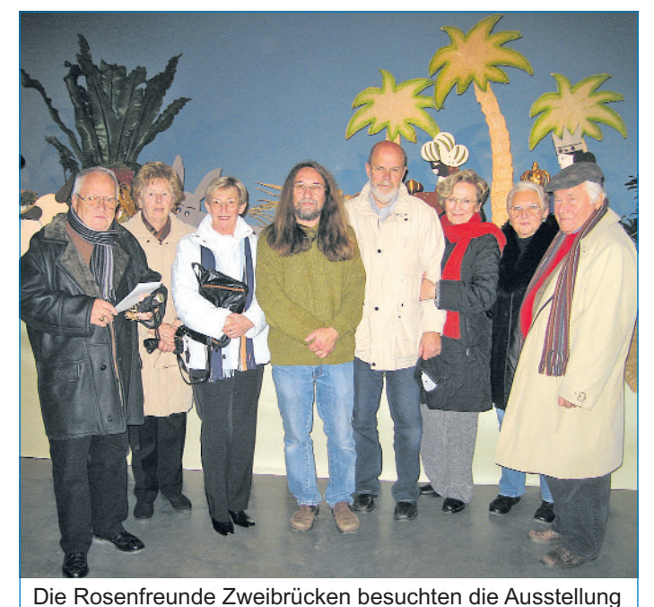
Die Rosenfreunde Zweibrücken besuchten die Ausstellung