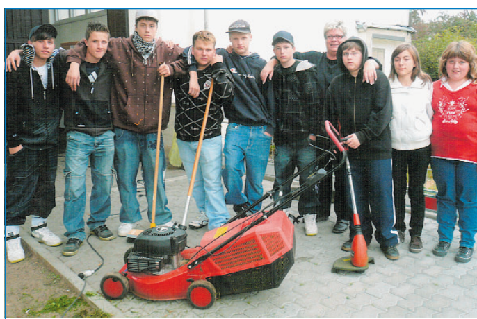
Jugendliche Helferinnen und Helfer beim Aufräumen rund um die Marienkirche in Fürstenhausen

geworfen haben. Aber das ist noch nicht alles. Die Grünflächen um die Marienkirche waren, bedingt durch die Reparatur der Schäden am Kirchenbau, vernachlässigt. So hatten es sich die fleißigen Helferinnen und Helfer zur Aufgabe gemacht, im Herbst den Rasen zu mähen, Laub zu rechnen und die befestigten Flächen um die Kirche herum zu kehren. Rund eineinhalb Stunden sind sie mittwochs mit Pflegemaßnahmen um die Marienkirche zu Gange. Die Jugendlichen kennen sich untereinander und haben sich bereits vor der Aktion regelmäßig an der Marienkirche getroffen. Wegen der baulichen Situation am Marienplatz bietet er ihnen momentan den „Raum“, wo sie auch mal für sich sein können. Ein