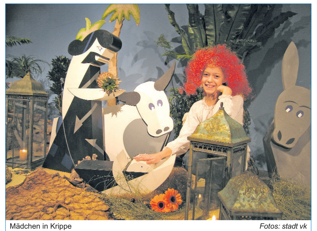
Mädchen in Krippe

die Region einmaligen Veranstaltung sprechen die zahlreichen Eintragungen im Gästebuch der Krippenausstellung. „Diese Ausstellung ist ein wunderbares, das Herz berührendes Erlebnis“, „Eine Bereicherung für Völklingen“ oder „Hier stimmt einfach alles. Sobald man den Raum betritt, erfasst einen tiefer Frieden. Ich wünsche mir diese Ausstellung für das ganze Jahr“ – mit solchen Zitaten brachten die Besucher ihre Begeisterung und Dankbarkeit für die großartigen Leistungen der Ausstellungsmacher zum Ausdruck. Die Völklinger Krippenausstellung war ohne Zweifel eine Bereicherung für die Stadt und ihre Besucher. Die Stadt Völklingen ist Mieterin der Erzhalle im Weltkulturerbe Völklinger Hütte und nutzte ihr Mietkontingent zum ersten Mal, um eine eigene mehrwöchige Ausstellung zu präsentieren.