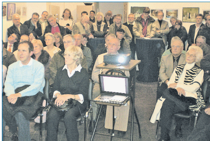
Umbaumaßnahmen stoßen auf breites Interesse