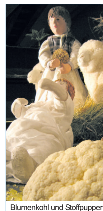
Blumenkohl und Stoffpuppen