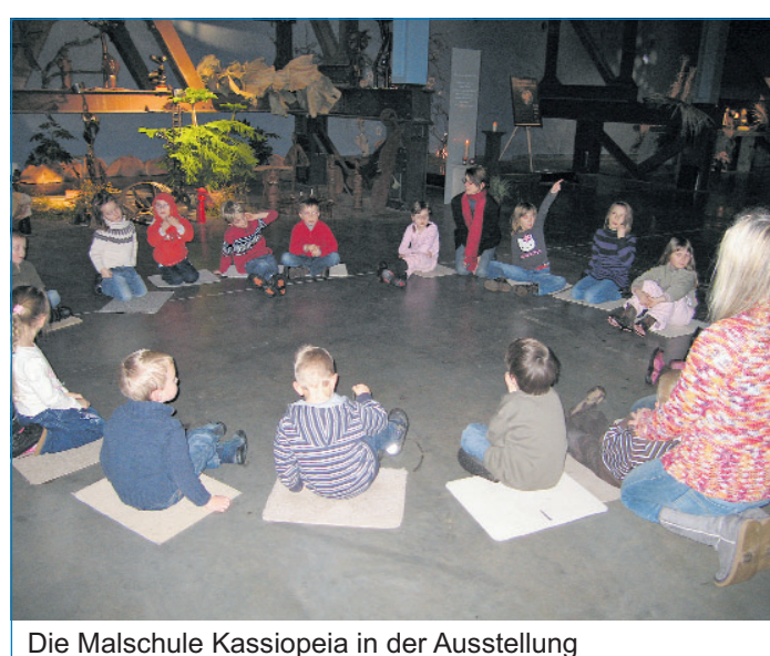
Die Malschule Kassiopia in der Ausstellung