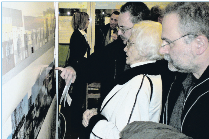
Entwürfe kamen gut bei den Bürgerinnen und Bürgern an

ein gewerbliches Gesamtkonzept für die Forbacher Passage angeregt. Die vorgestellten Pläne hängen im Stadteiltreff Völklingen in der Bismarckstraße 20 aus. Dort können noch bis zum 30. Januar 2009 von allen Bürgerinnen und Bürgern weitere Anregungen mitgeteilt werden. he